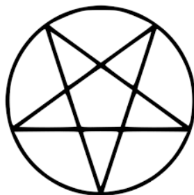
Gambar 3. Pentagram

Simbol satanisme yang kedua adalah pentagram . Pentagram adalah salah satu simbol satanisme yang digambarkan secara terbalik. Simbol pentagram dapat dilihat dari gambar berikut.