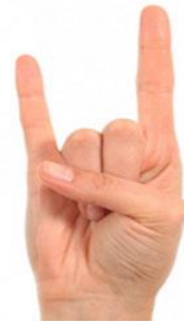
Gambar 7. Horned Hand

Simbol satanisme yang keenam adalah horned hand . Simbol horned hand (tangan bertanduk) berasal dari kata-kata Mano Cornuto yang berarti "Kesetiaan pada Setan". Simbol horned hand dapat dilihat dari gambar berikut.