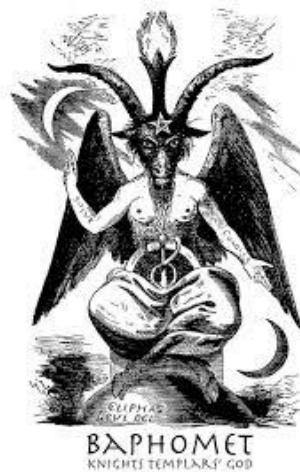
Gambar 2. Baphomet

Simbol satanisme yang pertama adalah Baphomet . Baphomet menjadi simbol utama pengikut satanisme. Pada abad ke-19, sosok Satanist (pengikut ajaran satanisme) bernama Elifas Levi menciptakan simbol ini. Simbol Baphomet dapat dilihat dari gambar berikut.