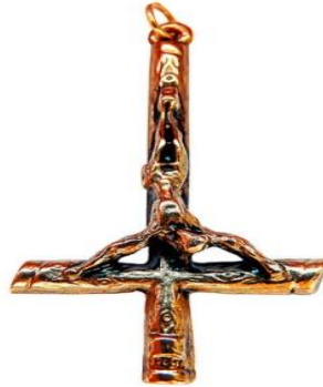
Gambar 5. Inverted Cross

Simbol satanisme keempat adalah inverted cross atau salib terbalik. Simbol salib terbalik adalah simbol yang menjadi identitas pengikut satanisme. Mereka menggunakan simbol ini sebagai kesetiaan dan kepatuhan mereka kepada setan. Simbol salib terbalik dapat dilihat dari gambar berikut.