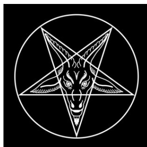
Gambar 4. Goat of Mendes

Simbol satanisme ketiga adalah goat of mendes . Goat of mendes berasal dari Mesir. Simbol yang menyerupai kepala kambing ini identik dengan pemujaan ritual satanisme. Simbol goat of mendes dapat dilihat dari gambar berikut.