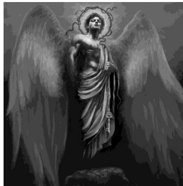
Gambar 8. Sigil of Lucifer

Simbol satanisme yang ketujuh adalah sigil of lucifer . Lucifer adalah nama lain dari setan. Lucifer adalah kombinasi dari kejahatan dan malaikat. Simbol sigil of lucifer dapat dilihat dari gambar berikut.