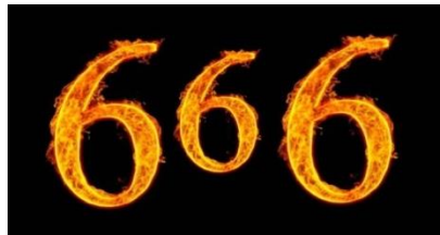
Gambar 6. The Beast 666

Simbol satanisme yang kelima adalah the beast 666. Simbol ini bukan hanya sekedar angka, melainkan angka setan. Simbol the beast 666 dapat dilihat dari gambar berikut.