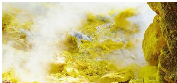
Gambar 10. Sulphur

Simbol satanisme yang kesembilan adalah sulphur atau belerang. Belerang adalah simbol satanisme yang melambangkan persatuan antara manusia dan setan. Belerang juga disebut sebagai unsur naluri setan. Simbol sulphur dapat dilihat sebagai berikut.