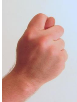
Gambar 9. Fig Hand

Simbol satanisme yang kedelapan adalah fig hand . Simbol fig hand berasal dari kata-kata Mano Fico yang berarti " Cunt Gesture ". Simbol ini sering dihubungkan dengan kebebasan seksual. Simbol fig hand dapat dilihat dari gambar berikut.