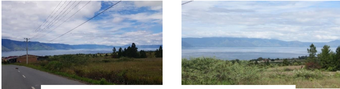
Gambar 7. Lahan-lahan hijau di Kecamatan Pangururan dan Simanindo

Kemudian di samping itu juga terdapat nilai-nilai budayaan etnis dari masyarakat batak yang masih kental hingga saat ini di kedua Kecamatan tersebut seperti peninggalan-peninggalan masih di jaga dan di lestarikan oleh warga lokal. Selain itu yang menjadi keunikan kawasan ini juga dapat dilihat dari bentuk dan jenis souvenir yang dijual oleh masyarakat.