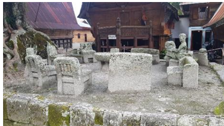
Gambar 8. Peninggalan budaya Batak

Kemudian di samping itu juga terdapat nilai-nilai budayaan etnis dari masyarakat batak yang masih kental hingga saat ini di kedua Kecamatan tersebut seperti peninggalan-peninggalan masih di jaga dan di lestarikan oleh warga lokal. Selain itu yang menjadi keunikan kawasan ini juga dapat dilihat dari bentuk dan jenis souvenir yang dijual oleh masyarakat.