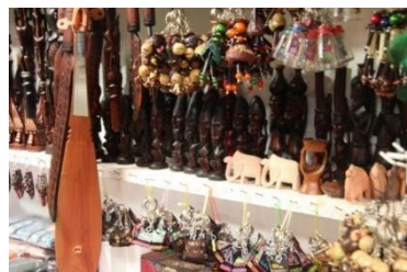
Gambar 9. Peninggalan budaya Batak

Dalam kajian ini, Pangururan dan Simanindo memiliki kebudayaan yang tidak jauh berbeda, mengingat etnis lokal yang ada sama-sama berasal dari etnis Batak. Begitu pula dengan budaya bertani/berladang yang masih mereka jalani hingga saat ini. Hal ini tentu saja semakin memberi dampak positif pada kawasan Kaldera Toba sebagai sektor pariwisata alam.