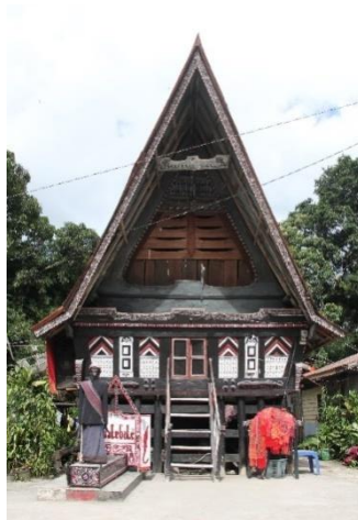
Gambar 6. Boneka Sigale- gale sebagai salah satu atraksi utama di Tomok

Pada Kecamatan Simanindo terdapat patung Sigale-gale yang terletak di desa Tomok. Patung ini sudah terkenal sejak lama dan kerap menarik perhatian wisatawan-wisatawan yang datang ke desa Tomok. Letak boneka Sigale-gale ini berada di atas bukit, dengan akses jalan yang dapat di tempuh melalui kios-kios souvenir yang ada di desa Tomok. Kondisi jalan menuju objek wisata ini sendiri menantang karena faktor kontur tanah. Kawasan boneka Sigale-gale dan desa Tomok sendiri cukup terjaga kebersihannya, hal ini di dukung dengan hasil rata-rata tingkat kenyamanan wisatawan terhadap kebersihan kawasan yang mencapai nilai 3,69 yang artinya berada pada rentang “cukup”.