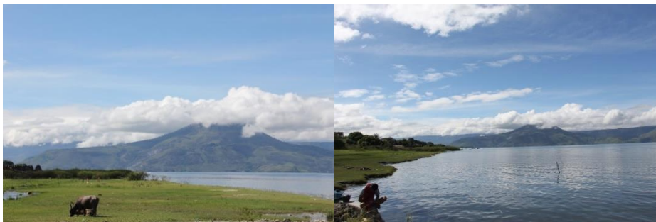
Gambar 11. Pemandangan lingkungan alam Kecamatan Pangururan dan Simanindo

Persepsi wisatawan dan masyarakat lokal juga penting untuk suatu objek wisata. Seperti yang terlihat pada tabel 4 bahwa baik wisatawan lokal maupun wisatawan asing keduanya bernilai total rata-rata hingga 4,59. Yang mana masuk kedalam kategori “baik” terhadap pendapat mereka mengenai pemandangan alam pada kedua kecamatan Penelitian (Simanindo dan Pangururan). Kemudian dapat dilihat juga pandangan wisatawan terhadap kualitas air dan kualitas udara di masing-masing kecamatan (simanindo dan pangururan). Wisatawan setuju bahwa kualitas air dan udara disetiap kecamatan sudah tergolong kedalam kategori “baik” (dengan nilai rata-rata 4,14 untuk kualitas air dan 4,37 untuk kualitas udara). Kemudian apabila dibandingkan dengan hasil rata-rata tingkat kebersihan dan kualitas air menurut masyarakat lokal maka masyarakat lokal menganggap bahwa daerah kawasan mereka sudah lebih dari cukup dalam hal ketersediaan air bersih dan juga kebersihan kawasannya. Hal ini dapat kita lihat pada tabel 5 dengan nilai rata-rata total mencapai 4,51 untuk ketersediaan air bersih, yang artinya “baik” dan 4,62 untuk kualitas udara.