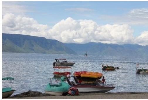
Gambar 5. Pantai Pasir Putih sebagai Landmark Kecamatan Pangururan