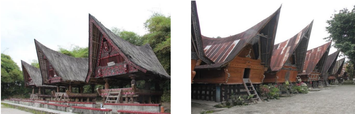
Gambar 10. Bangunan Tradisional

Wisatawan Asing, keduanya setuju (dengan hasil rata-rata 3,8 yang mana tergolong dalam kategori “cukup”) bahwa rumah-rumah adat yang ada masih terjaga kebersihannya sehingga menarik minat para wisatawan.