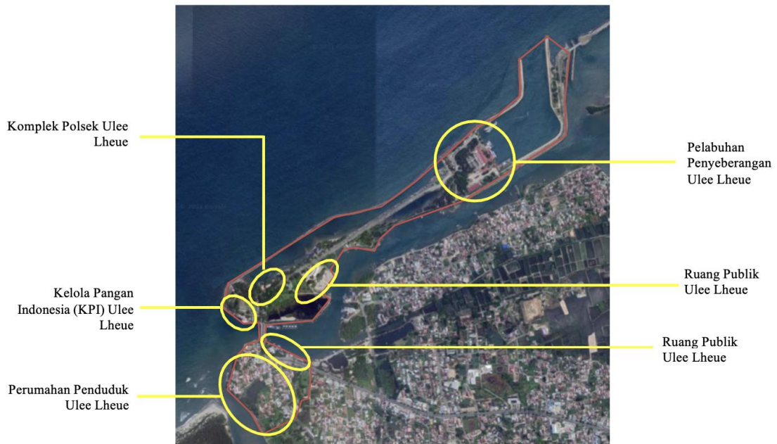
Gambar 2. Identifikasi Area Komersil Penggunaan Tanah Pada Kawasan Peri Urban Ulee Lheue.

Mengembangkan dan menumbuhkan kota pada arah tertentu memiliki faktor perkembangan maupun pertumbuhan pola yang mempengaruhinya [13] : (1) dari segi faktor manusia, yaitu meliputi bagaimana pertumbuhan jumlah penduduk perkotaan baik disebabkan oleh angka kelahiran maupun karena jumlah urbanisasi yang terjadi, selanjutnya meliputi perkembangan, status sosial, perkembangan tenaga pekerjaan dan perkembangan kemampuan pengetahuan dan serta teknologi; (2) dari segi faktor aktifitas manusia, yaitu meliputi segala bentuk kegiatan perekonomian, kegiatan fungsional, kegiatan kerja dan kegiatan hubungan regional yang lebih luas; (3) dari segi faktor pola pergerakan, yaitu meliputi dampak yang disebabkan oleh kedua faktor antara faktor perkembangan penduduk dengan faktor perkembangan fungsi kegiatan yang menuntut pola hubungan antara pusat-pusat kegiatan terjadi.