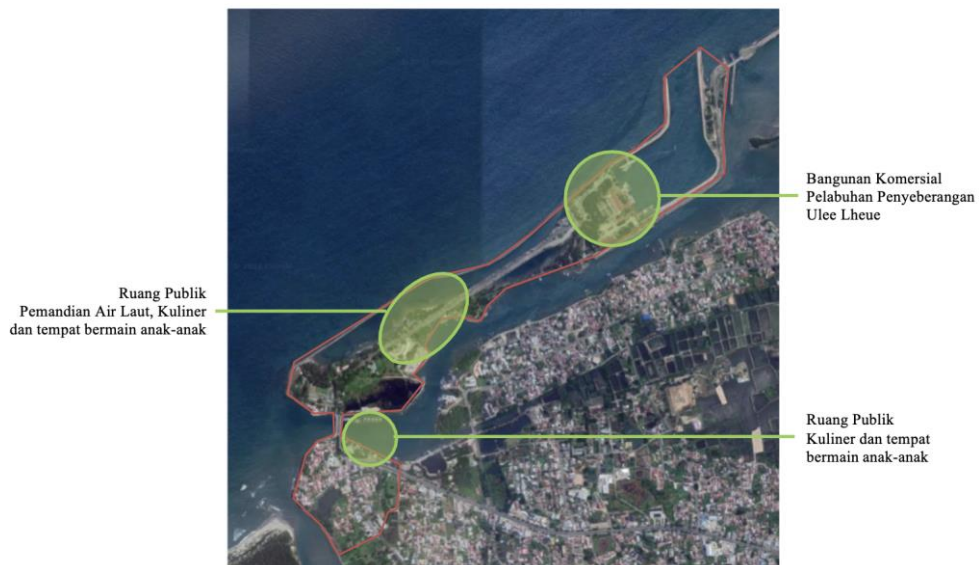
Gambar 3. Kajian Pola Aktivitas Manusia Terhadap Bangunan dan Ruang Publik Ulee Lheue.

Kawasan peri urban Ulee Lheue sendiri pola penggunaan lahannya didominasi oleh bangunan komersil dan ruang publik, yang berarti segala bentuk dari aktifitas manusia berupa aktifitas kerja, aktifitas fungsional dan aktifitas perekonomian kota pada kawasan tersebut terjadi dengan sangat pesat. Hal ini juga disebabkan oleh posisi dari kawasan peri urban Ulee Lheue tersebut dekat dengan pusat Kota Banda Aceh, pada Gambar 3 dapat dilihat titiktingkat pola aktivitas pergerakan manusia terhadap bangunan komersil dan ruang publik di Ulee Lheue.