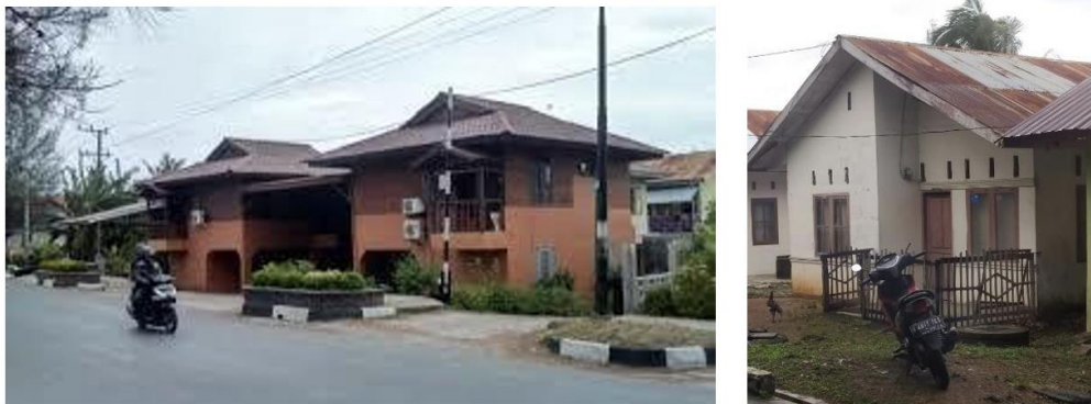
Gambar 6. Bentuk dan Tipe Rumah pada Kawasan Peri Urban Ulee Lheue.

Pada dasarnya pola cluster cenderung tampil dengan ruang-ruang yang ukurannya tidak sama atau berlainan seperti bentuk maupun fungsi yang tidak sama akan tetapi berhubungan antara satu dengan yang lainnya. Memiliki ciri pola yang dinamis, pola cluster memiliki sifat yang mampu beradaptasi akan pertumbuhan serta perubahan yang terjadi secara langsung tanpa mempengaruhi apa yang menjadi karakternya. Di Gambar 6 dapat dilihat bentuk bangunan pada permukiman penduduk di kawasan peri urban Ulee Lheue.