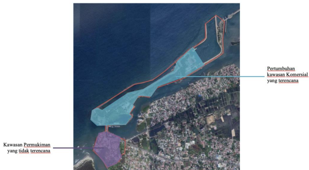
Gambar 1. Kajian Pola Penggunaan Tanah Pada Kawasan Peri Urban Ulee Lheue.

Pada dasarnya tipologi akan mengelompokkan tipe dari suatu objek yang memiliki karakteristik sendiri atau ciri khasnya sendiri, mengelompokkan objek sebagai model melalui analisis kesamaan bentuk, fungsi dan juga struktur. Selain itu tipologi berfungsi mengklasifikasikan dan mengkategorikan sehingga menghasilkan sebuah pengelompokkan tipe baru yang sekaligus dapat dilihat keragaman dan keseragamannya [9]. Penggunaan tanah pada kawasan peri urban Ulee Lheue terdiri dari beberapa macam kategori yang bisa dilihat pada Gambar 1 berikut ini.