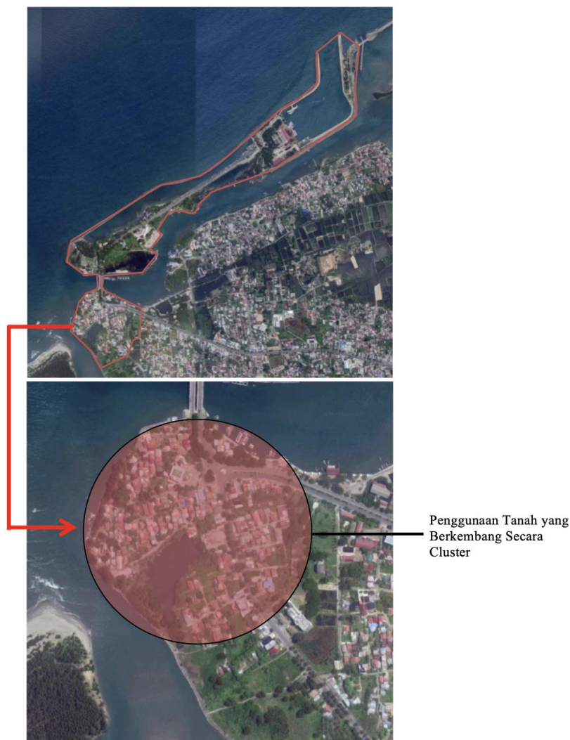
Gambar 4. Kajian Pola Penggunaan Tanah pada Bangunan di Kawasan Peri Urban Ulee Lheue.

Sejalan dengan peningkatan penduduk dan aktifitasnya, kebutuhan akan ruang perkotaan semakin meningkat, dengan terbatasnya lahan perkotaan maka peningkatan lahan yang dibutuhkan untuk tempat tinggal dan kegiatan ekonomi perkotaan mengambil ruang meluas ke arah luar bahkan sampai di pinggiran kota. Gejala ini memiliki istilah invasi yang memiliki artian meluapnya penduduk dari pusat kota dan kondisi kenampakan fisik ke arah luarkota ini disebut dengan urban sprawl [15]. Kawasan pertumbuhan permukiman penduduk Ulee Lheue dapat dilihat pada Gambar 4.