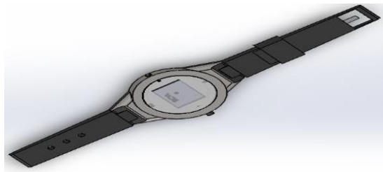
Gambar 1. Gelang Pengukur CVL

Hasil akhir rancangan produk Gelang Pengukur CVL dapat dilihat pada gambar 1 dibawah ini: