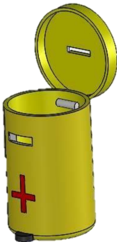
Gambar 2. Hasil Rancangan Produk Akhir Medic Waste Sterilizer

Spesifikasi hasil akhir dari rancangan produk medic waste sterilizer terdiri dari dua fungsi, yaitu fungsi utama dan fungsi tambahan. Hasil rancangan produk akhir dapat dilihat seperti pada gambar dibawah ini.