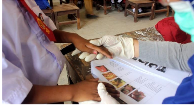
Gambar 4. Pemeriksaan kulit dan kuku