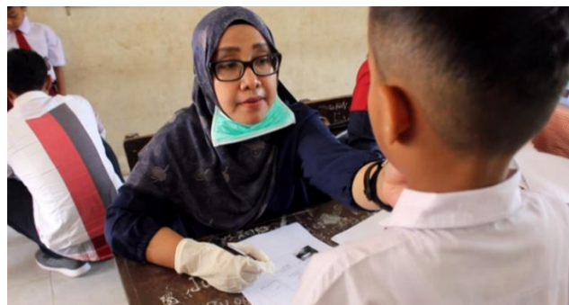
Gambar 3. Pemeriksaan kelenjar