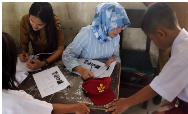
Gambar 5. Penimbangan berat badan

Gejala yang dapat diamati ( sign ) dan gejala yang tidak dapat diamati, tetapi dirasakan oleh penderita ( symptom ) dapat diketahui melalui pemeriksaan fisik. Pemeriksaan ini juga meliputi semua perubahan fisik yang berkaitan dengan malnutrisi yang terlihat pada kulit atau jaringan epitel, jaringan yang membungkus permukaan tubuh seperti rambut, mata, muka, mulut, gigi, lidah, dan kelenjar tiroid [2]. Catatan tentang semua kejadian yang berhubungan dengan gejala serta faktor-faktor yang mempengaruhi timbulnya penyakit juga perlu disusun [6].