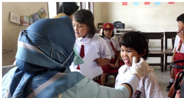
Gambar 2. Pemeriksaan lidah dan gigi