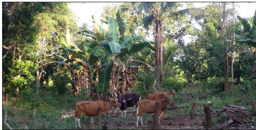
Gambar 2. Diversifikasi usaha tani yang dilakukan petani sutera

Bahan makanan pokok berupa beras biasanya mereka stok pada saat memperoleh pendapatan berupa harga kokon ataupun benang yang optimal sesuai sumberdaya yang dimiliki. Saat budidaya ulat sutera yang dilakukan tidak mengalami serangan penyakit atau sebageian besar ulat sutera mampu membentuk kokon merupakan kondisi panen yang optimal. Sebagian besar petani sutera khususnya di Desa Sering, Kecamatan Donri-Donri tidak memiliki sawah, sehingga membeli beras di pasar, sedangkan jagung biasanya diperoleh dari hasil kebun sendiri.. Adapun pemenuhan kebutuhan pangan seperti buah biasanya diperoleh dari kebun sendiri (pepaya, mangga) dan kadang-kadang pemberian dari tetangga. Sedangkan konsumsi daging biasanya hanya diadakan pada hari lebaran atau ada hajatan, karena untuk konsumsi sehari-hari kebutuhan protein lebih banyak mengkonsumsi ikan. Meskipun demikian, mereka tidak pernah kekurangan pangan, karena warga menerima bantuan pemerintah berupa beras raskin yang dijatah 20 kg /bulan. Menurut [19] mengonsumsi bahan pangan produksi sendiri merupakan salah satu strategi petani pedesaan untuk memenuhi kebutuhan pangan rumah tangga. Hal ini terlihat nyata pada petani sutera dengan melakukan diversifikasi usahatani (Gbr 2.)