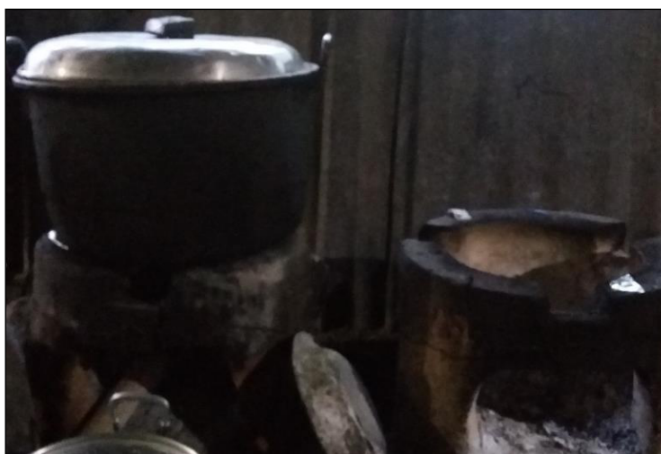
Gambar 3. Pemenuhan kebutuhan energi kalor menggunakan kayu bakar melalui tungku (Foto: Koleksi penulis, 2017)

Energi kalor yang diperlukan untuk mengolah makanan umumnya menggunakan gas dan kayu bakar yang dikombinasi penggunaannya sesuai kondisi keuangan rumah tangga. Wilayah perkampungan yang didominasi hutan jati memungkinkan petani untuk memanfaatkan ranting-ranting kayu yang jatuh sebagai kayu energi. Untuk memasak air minum dan menanak nasi biasanya menggunakan kayu bakar. Beberapa faktor yang dapat memengaruhi konsumsi kayu bakar antara lain: jumlah penghasilan keluarga, tersedianya kayu bakar dengan harga terjangkau dan harga minyak tanah dan gas [1].